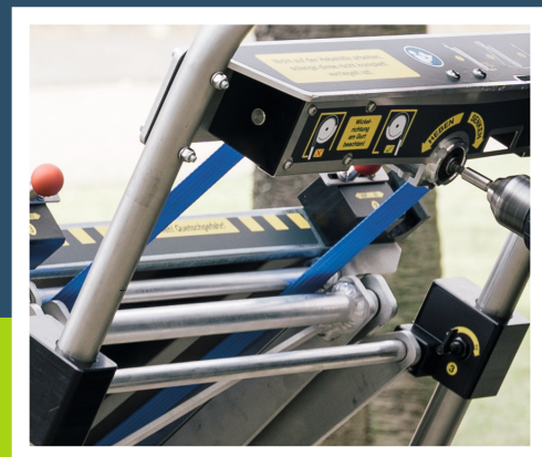
Patentierte, innovative Gurtmechanik