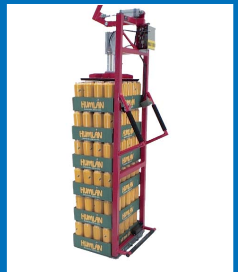
Tray- und Stapelhandlung