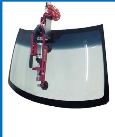
Montagetechnik (z.B. Windschutzscheiben)