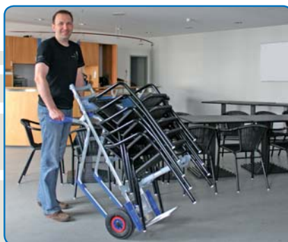
Type 2 011 21 + Zusatz 1144, bis zu 10 Stühle können mit dem Stuhlzusatz bequem transportiert werden