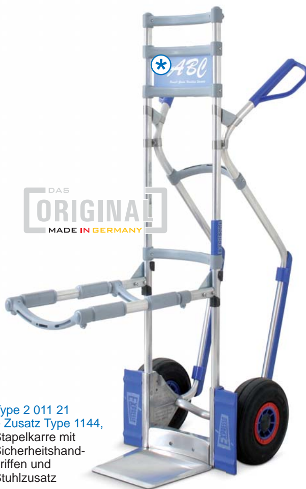
Type 2 011 21 + Zusatz Type 1144, Stapelkarre mit Sicherheitshandgriffen und Stuhlzusatz