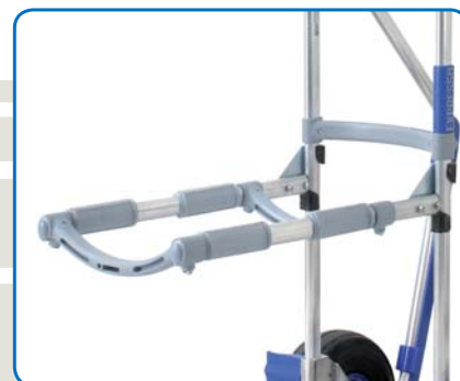
Stuhlzusatz Type 1144, anklemmbarer Stuhlzusatz – flexibel einsetzbar